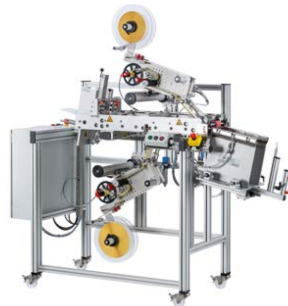
Beuteletikettieranlage für Klotz- und Kreuzbodenbeutel: universell, funktionell und flexibel

Heute bestehe die besondere Herausforderung für Verpa-